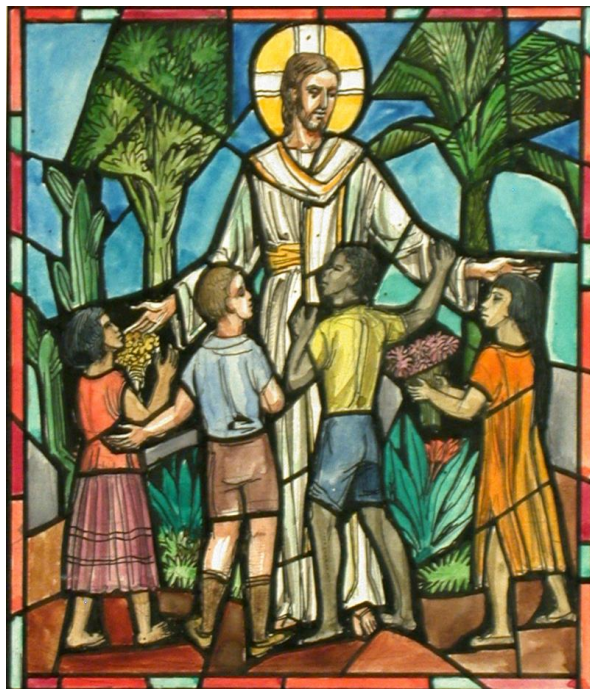
Jesus Welcomes the Children 耶穌歡迎小朋友到祂那裡

讚美一神萬福之源，天下生靈都當頌言； 天上萬軍也讚主名，同心讚美父子聖靈。阿們。