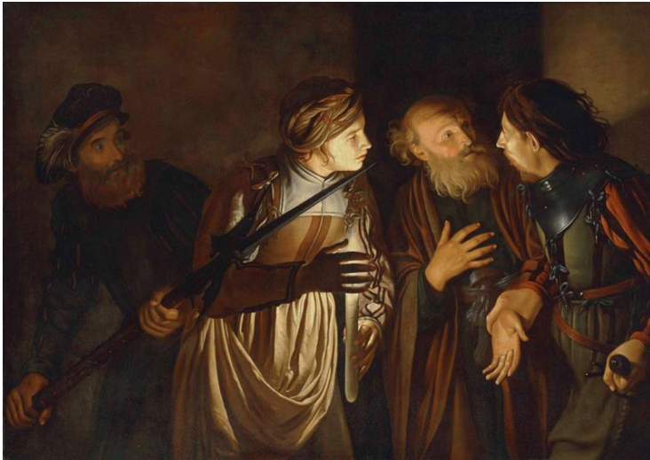
Peter's Denial 彼得不認主

讚美一神萬福之源，天下生靈都當頌言； 天上萬軍也讚主名，同心讚美父子聖靈。阿們。