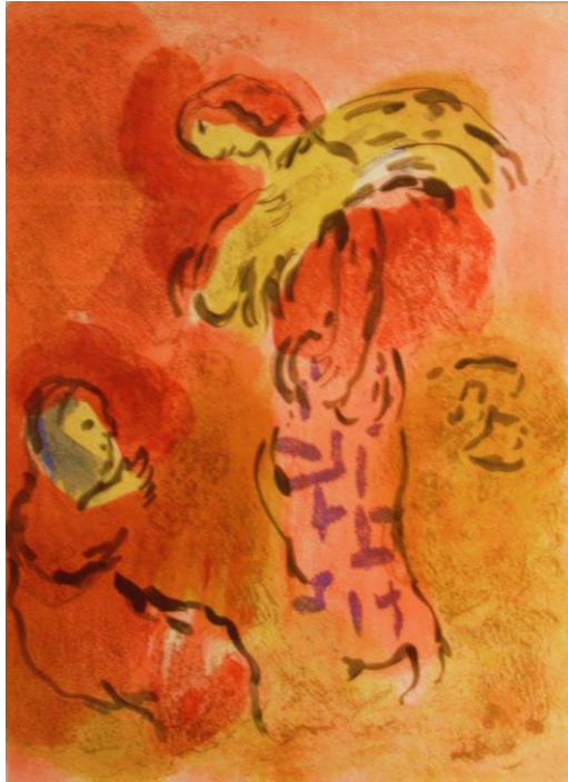
Ruth and Naomi 路得與拿俄米

讚美一神萬福之源，天下生靈都當頌言； 天上萬軍也讚主名，同心讚美父子聖靈。阿們。