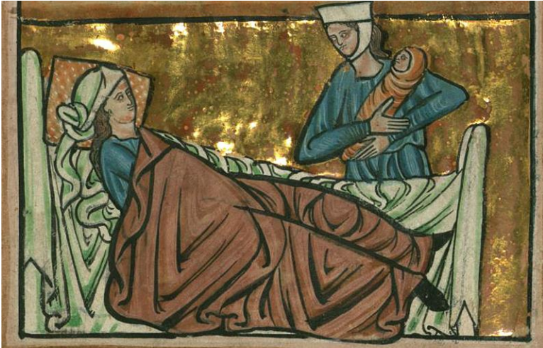
Hannah Bears a Child 哈拿得子

讚美一神萬福之源，天下生靈都當頌言； 天上萬軍也讚主名，同心讚美父子聖靈。阿們。