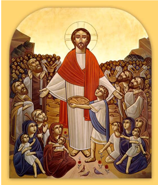
Christ Feeding the Multitude 基督餵飽眾人

讚美一神萬福之源，天下生靈都當頌言； 天上萬軍也讚主名，同心讚美父子聖靈。阿們。