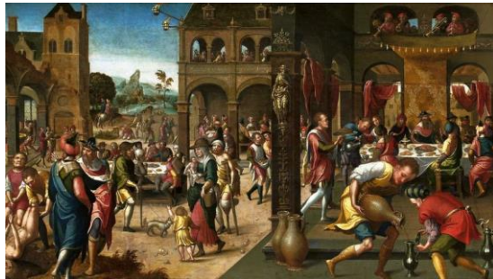
Parable of the Great Banquet 耶穌的比喻 - 娶親的筵席（太 22:1 - 14）