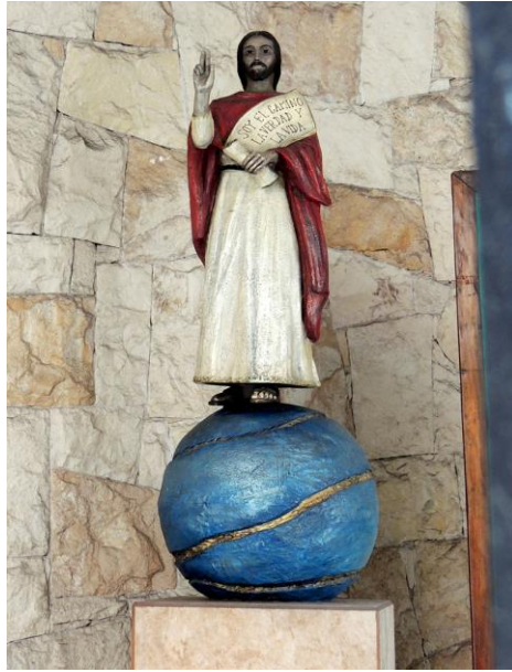
Christ as The Way, The Truth, The Life 基督是道路、真理、生命