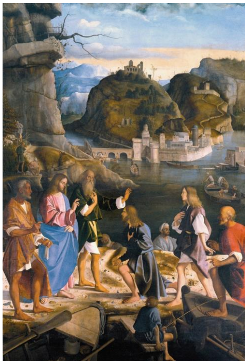
Call of the Sons of Zebedee 耶穌呼召西庇太的兒子