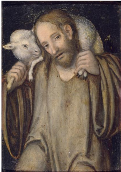
“Christ as the good shepherd” 基督是好牧人