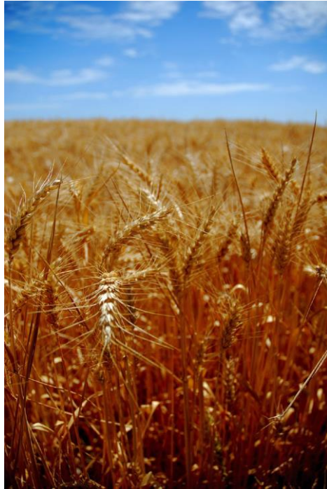
“Soon for the harvest...” 莊稼已經熟了

讚美一神萬福之源，天下生靈都當頌言； 天上萬軍也讚主名，同心讚美父子聖靈。阿們。