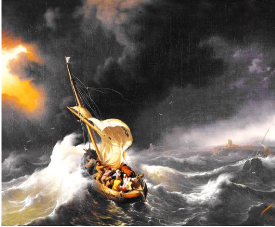
“Christ in the Storm on the Sea of Galilee”

讚美一神萬福之源，天下生靈都當頌言； 天上萬軍也讚主名，同心讚美父子聖靈。阿們。