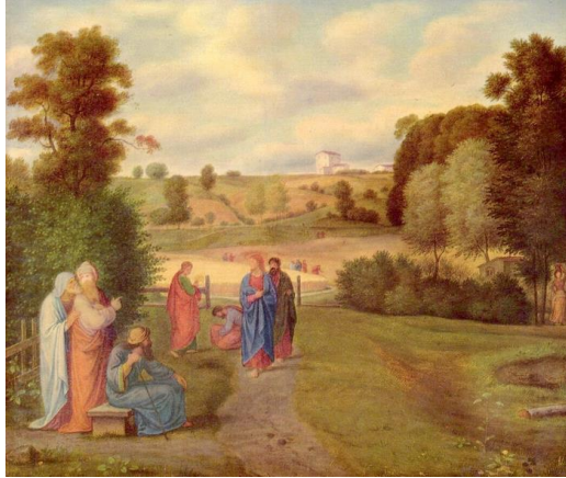
“Jesus with Disciples” 耶穌與門徒在一起

讚美一神萬福之源，天下生靈都當頌言； 天上萬軍也讚主名，同心讚美父子聖靈。阿們。