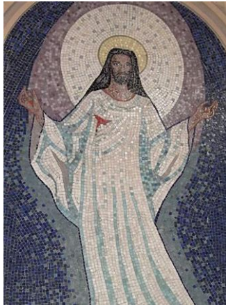
“Resurrection of Christ” 基督已復活

讚美一神萬福之源，天下生靈都當頌言； 天上萬軍也讚主名，同心讚美父子聖靈。阿們。