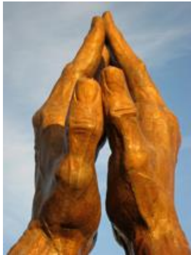
“Praying Hands” 祈禱之手

讚美一神萬福之源，天下生靈都當頌言； 天上萬軍也讚主名，同心讚美父子聖靈。阿們。