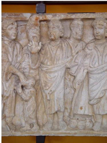
“Christ Healing the Blind” 基督醫治瞎眼的

讚美一神萬福之源，天下生靈都當頌言； 天上萬軍也讚主名，同心讚美父子聖靈。阿們。