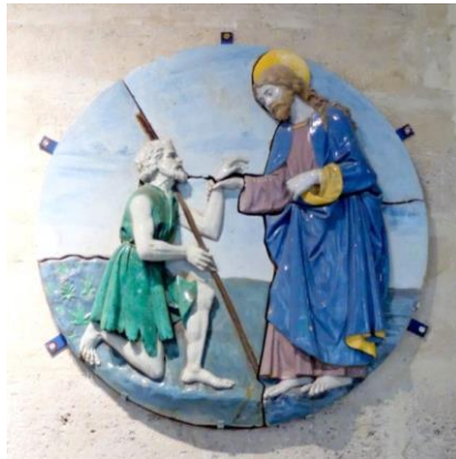
“Christ comforting a poor man” 基督安慰貧苦人