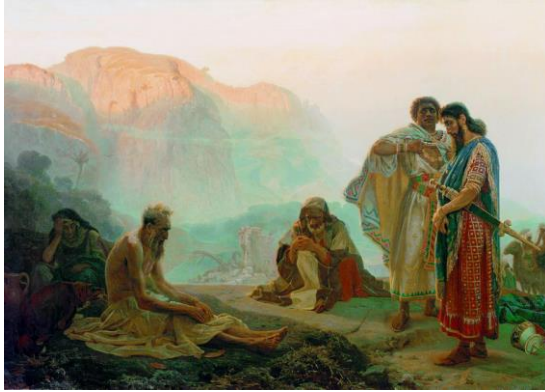
“Job and His Friends” 約伯與朋友

讚美一神萬福之源，天下生靈都當頌言； 天上萬軍也讚主名，同心讚美父子聖靈。阿們。