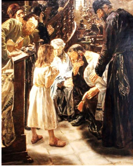
Jesus Among the Doctors 孩童耶穌在聖殿坐在教師中間

讚美一神萬福之源，天下生靈都當頌言； 天上萬軍也讚主名，同心讚美父子聖靈。阿們。