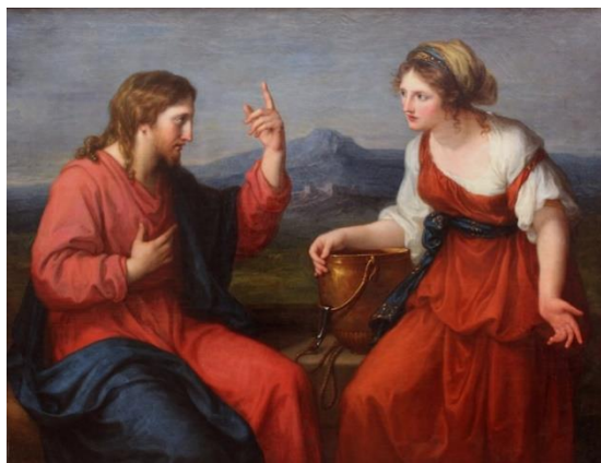
Christ and the Samaritan Woman 基督與撒瑪利亞婦人

讚美一神萬福之源，天下生靈都當頌言； 天上萬軍也讚主名，同心讚美父子聖靈。阿們。