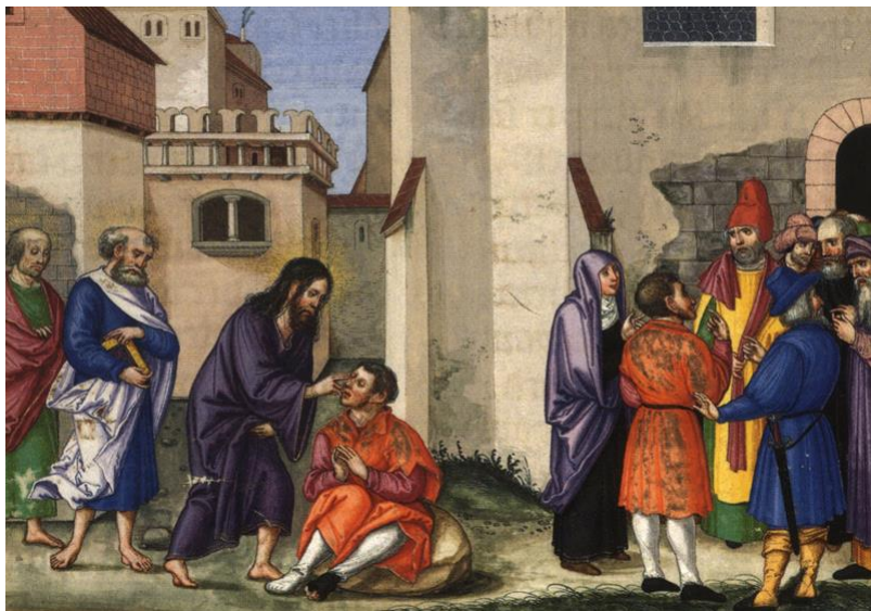
Healing of the Man Born Blind 基督醫治生來瞎眼的