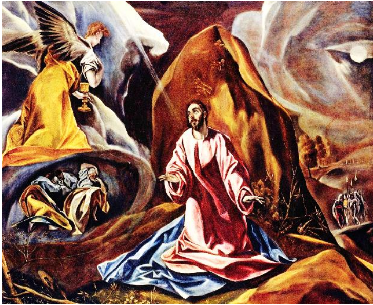
Christ on Mount of Olives 橄欖山上的基督