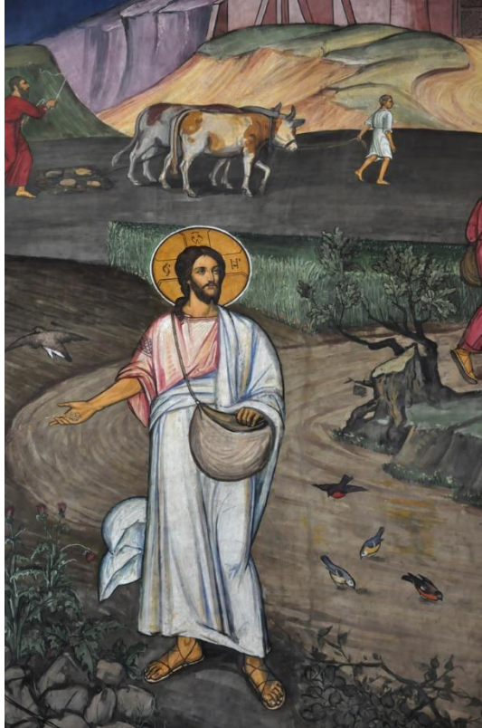
Sower went out to sow 耶穌講撒種的比喻

讚美一神萬福之源，天下生靈都當頌言； 天上萬軍也讚主名，同心讚美父子聖靈。阿們。