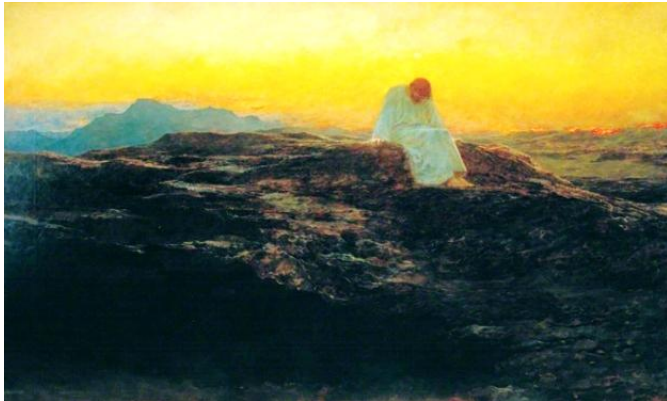
Temptation in the Wilderness 耶穌到曠野，四十天受魔鬼的試探