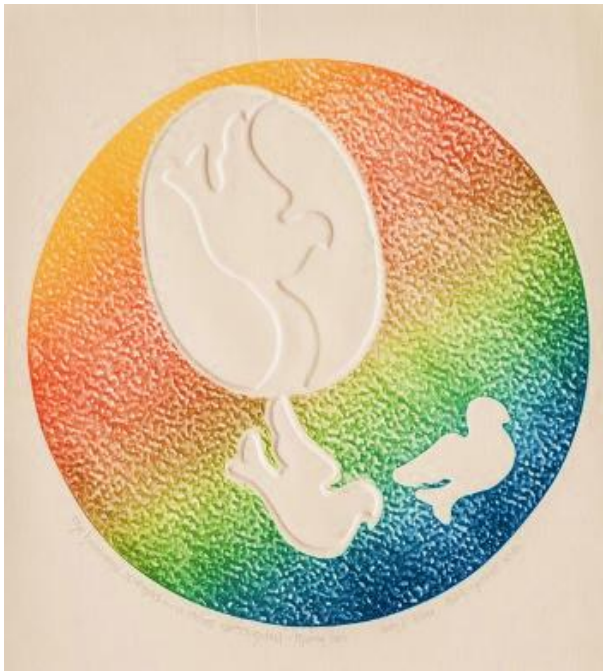
The Heavens Opened, A Dove Descended

讚美一神萬福之源，天下生靈都當頌言； 天上萬軍也讚主名，同心讚美父子聖靈。阿們。